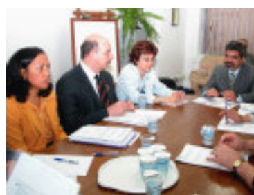
Funcionários, Estado, município e comunidade estão representados no Conselho de Administração do GHC, presidido pelo ministro da Saúde, Humberto Costa