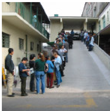
Junho de 2003: pacientes sujeitos à intempérie

Projeto pretende modificar realidade histórica de superlotação na maior Emergência do Estado