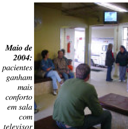
Maio de 2004: pacientes ganham mais conforto em sala com televisão

A proposta de acolhimento implantada no começo de março na Emergência do Hospital Conceição não foi concebida apenas para terminar com as filas na rampa do setor. A situação colocava em risco os usuários, sujeitos à intempérie e mesmo a atropelamentos ao dividir espaço com carros e ambulâncias. Além de maior agilidade no atendimento, o novo setor possui sala de espera com capacidade para 50 pessoas sentadas, ventiladores e televisor, oferecendo maior conforto à população. No entanto, o objetivo do projeto vai mais longe. Ao mudar o modelo de atenção na maior Emergência do Estado, a Diretoria do Grupo Hospitalar Conceição (GHC) pretende modificar uma realidade que acabou sendo considerada normal no setor ao longo dos anos: 100 pessoas internadas num local que possui 50 leitos e uma longa fila de espera.