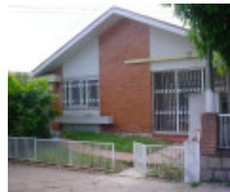
Sede do CAPS/AD

A integração do Grupo Hospitalar Conceição com a Secretaria Municipal de Saúde de Porto Alegre tem resultado em inúmeras ações conjuntas. Entre elas, destaca-se a implantação do Centro de Atendimento Psicossocial de Álcool e Drogas (CAPS/AD).