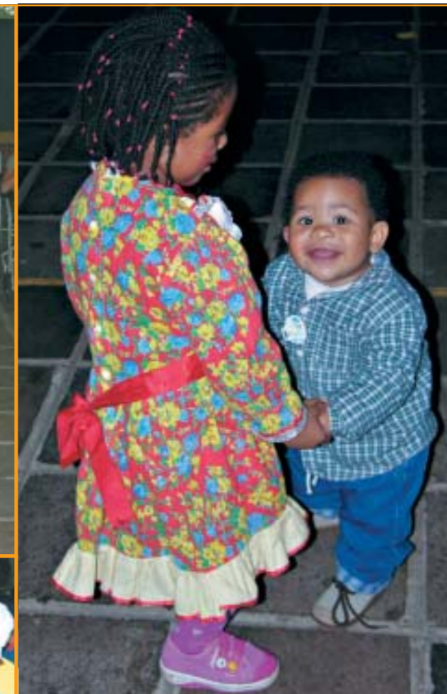
Palhaço, casamento na roça e grupo de pagode foram algumas das atrações que garantiram diversão para adultos e crianças na festa de São João promovida pelo GHC.