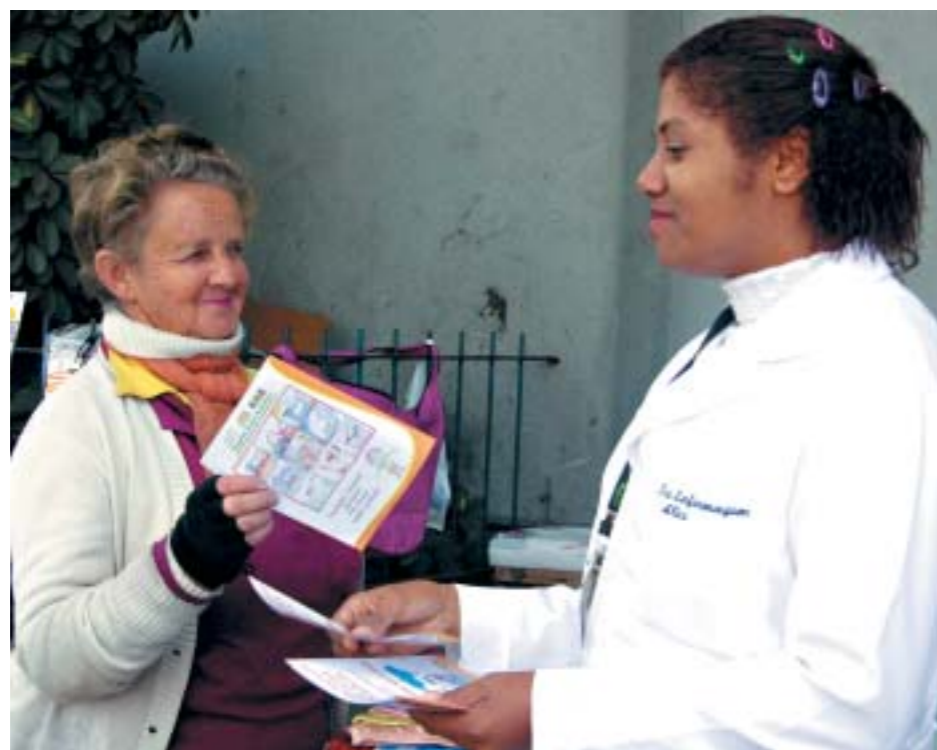
Equipe do Hospital Cristo Redentor distribuiu folders e orientou a população

Além da apresentação da faixa com o slogan "Essa dor pode ser evitada", a equipe multidisciplinar da Unidade de Queimados do Cristo Redentor, formada por médicos, enfermeiros, técnicos e auxiliares de enfermagem, assistente social e funcionários administrativos, também distribuiu folders e orientou a população sobre o perigo de acidentes com fogo. Eles ficaram na esquina das 10h às 16h, no dia de São João.