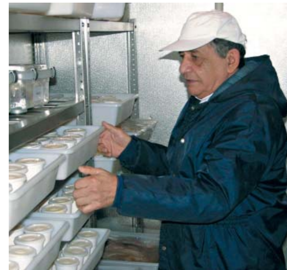
Segundo os funcionários, as novas câmaras deixam o trabalho 100% melhor

Cerca de 200 profissionais atuam no Serviço de Nutrição do HNSC, sendo responsáveis pela produção e distribuição dos alimentos, bem como pelo acompanhamento nutricional dos pacientes internados.