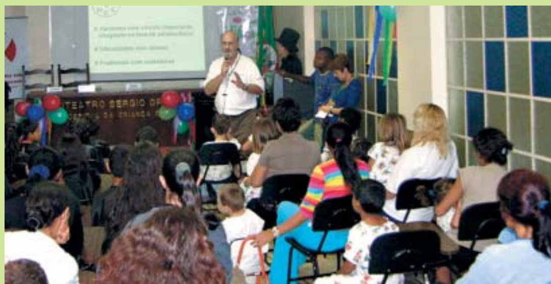
Pequenos mágicos, entre 8 e 12 anos, receberam o diploma devidamente paramentados