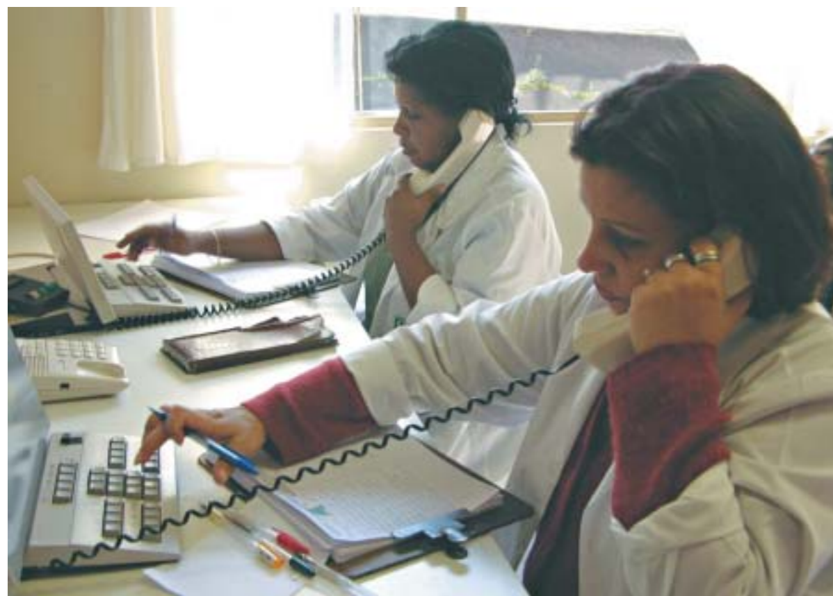
Atenção e agilidade no atendimento ao público que busca informações pelo telefone