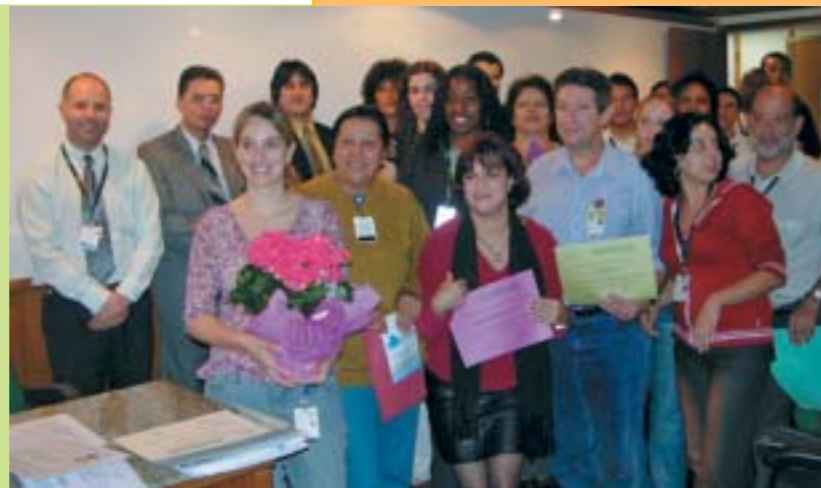
Funcionários da área de segurança, no encerramento do curso

incluem cursos de capacitação, reciclagem e formação de vigilantes. O curso de Gerência Patrimonial foi realizado na PUC por nove funcionários do Conceição, o curso de monitoramento de circuito fechado de TV foi ministrado no GHC e contou com 16 alunos. 28 funcionários receberam capacitação para melhoria da qualidade do atendimento ao público. Esse curso foi realizado em parceria entre o GHC e a Associação das Santas Casas e Hospitais Filantrópicos.